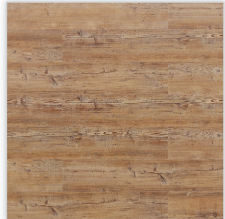
Wicanders, Panele winylowe Hydrocork Wzór: Arcadian Rye Pine. Wymiar [mm]: 1225/145/6. Wykończenie: trudnościścieralna warstwa winylu + lakier poliuretanowy. Montaż: bezklejowe łączenie Pressfit.