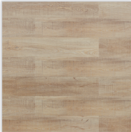
Wicanders, Panele winylowe Hydrocork Wzór: Sawn Bisque Oak. Wymiar [mm]: 1225/145/6. Wykończenie: trudnościścieralna warstwa winylu + lakier poliuretanowy. Montaż: bezklejowe łączenie Pressfit.