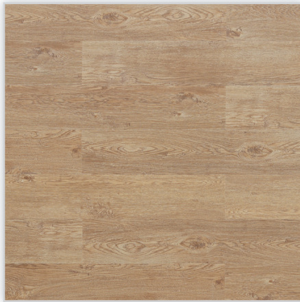
Wicanders, Panele winylowe Hydrocork Wzór: Castle Raffia Oak. Wymiar [mm]: 1225/145/6. Wykończenie: trudnościścieralna warstwa winylu + lakier poliuretanowy. Montaż: bezklejowe łączenie Pressfit.