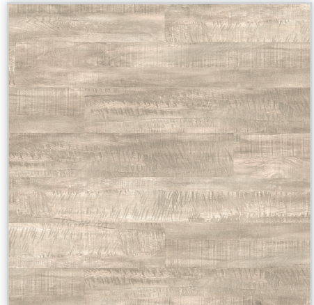
Wicanders, Panele winylowe Hydrocork Wzór: Claw Silver Oak. Wymiar [mm]: 1225/145/6. Wykończenie: trudnościścieralna warstwa winylu + lakier poliuretanowy. Montaż: bezklejowe łączenie Pressfit.