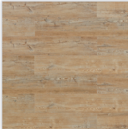
Wicanders, Panele winylowe Hydrocork Wzór: Arcadian Soya Pine. Wymiar [mm]: 1225/145/6. Wykończenie: trudnościścieralna warstwa winylu + lakier poliuretanowy. Montaż: bezklejowe łączenie Pressfit.