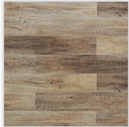
Wicanders, Panele winylowe Hydrocork Wzór: Sawn Twine Oak. Wymiar [mm]: 1225/145/6. Wykończenie: trudnościścieralna warstwa winylu + lakier poliuretanowy. Montaż: bezklejowe łączenie Pressfit.