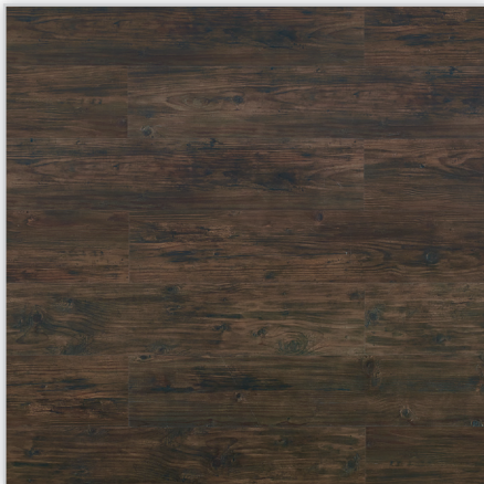
Wicanders, Panele winylowe Hydrocork Wzór: Century Morocco Pine. Wymiar [mm]: 1225/145/6. Wykończenie: trudnościścieralna warstwa winylu + lakier poliuretanowy. Montaż: bezklejowe łączenie Pressfit.