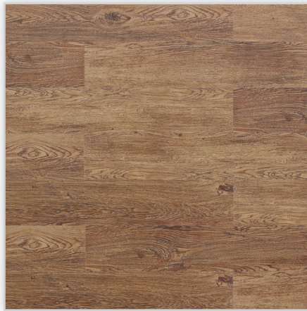
Wicanders, Panele winylowe Hydrocork Wzór: Castle Toast Oak. Wymiar [mm]: 1225/145/6. Wykończenie: trudnościścieralna warstwa winylu + lakier poliuretanowy. Montaż: bezklejowe łączenie Pressfit.