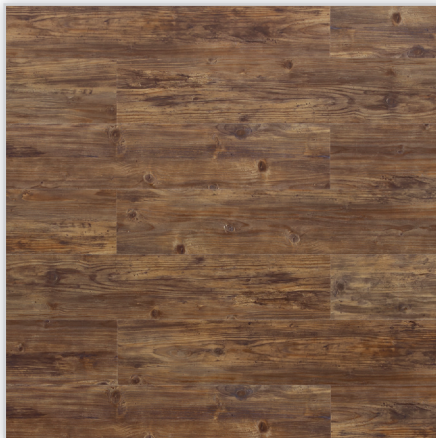
Wicanders, Panele winylowe Hydrocork Wzór: Century Fawn Pine. Wymiar [mm]: 1225/145/6. Wykończenie: trudnościścieralna warstwa winylu + lakier poliuretanowy. Montaż: bezklejowe łączenie Pressfit.